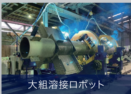
大組溶接ロボット