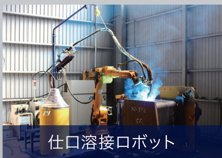
仕口溶接ロボット